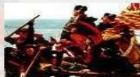
Revolução Americana, 1776 - George Washington suprime os ingleses no rio Delaware

LA INFLUENCIA DE LAS IDEAS REVOLUCIONARIAS: LA ILUSTRACIÓN, LIBERALISMO REVOLUCIÓN FRANCESA INDEPENDENCIA DE EE.UU.