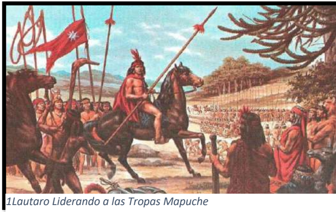
1Lautaro Liderando a las Tropas Mapuche

En diciembre de 1553, tras ser elegido toqui general por una alianza de linajes y respaldado por Colocolo, Lautaro se apoderó del fuerte de Tucapel al frente de varios miles de guerreros. Permaneció allí, sabiendo que los españoles intentarían recuperarlo, lo que efectivamente intentó Pedro de Valdivia al enterarse de la noticia. El gobernador español se puso en marcha hacia Tucapel con medio centenar de jinetes españoles, pero al llegar se vio rodeado por los guerreros indígenas. En esta batalla Lautaro, en vez de atacar en masa, empleó como estrategia a grupos sucesivos de guerreros. Cada bloque de indios se alternaba en el combate para no detener la contienda, posibilitando recobrar la fuerza y desgastar al enemigo. Tras un combate victorioso, Valdivia fue tomado prisionero, torturado y muerto. La sangre del conquistador vencido enardeció a los linajes indios, que se alzaron en numerosas partes y enviaron ayuda a Lautaro en sus nuevas incursiones militares.