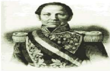
José Joaquín Prieto (1831 – 1841)