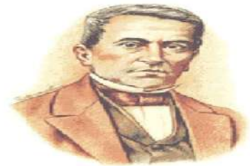
Manuel Montt (1851 – 1861)

Explica los aspectos generales de cada presidente conservador y sus principales medidas de gobierno