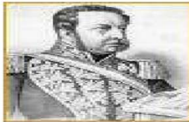
Manuel Bulnes (1841 – 1851)